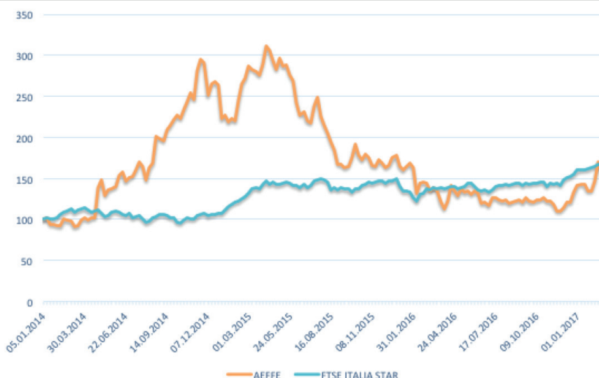
GRAFICO "ANDAMENTO TITOLO VS INDICE DI RIFERIMENTO" - PERIODO 1-1-2014/3-3-2017

* i dati finanziari al 31 dicembre 2016 saranno resi noti dopo il 9 marzo 2017 Dati espressi in milioni di Euro