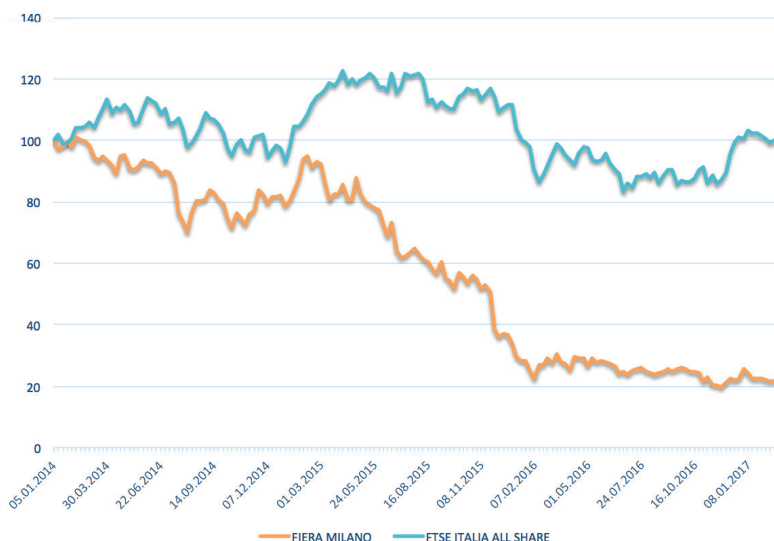
GRAFICO "ANDAMENTO TITOLO VS INDICE DI RIFERIMENTO" - PERIODO 1-1-2014/10-3-2017

Dati espressi in milioni di Euro - Fonte Borse Italiana